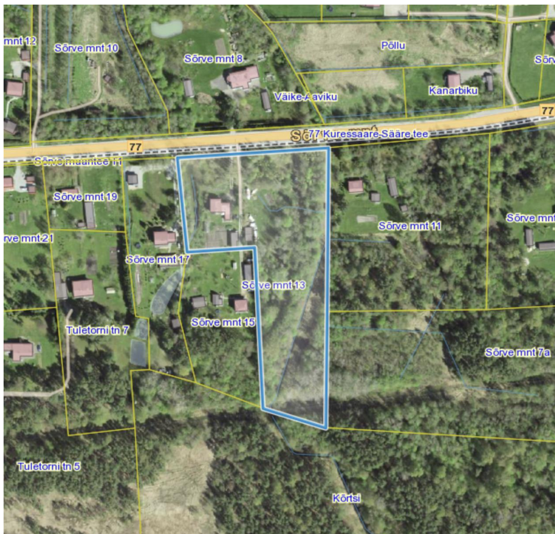
Joonis 1. Planeeringuala asendiskeem (Alus: Maa-ameti X-Gis kaardiserver, 2022)

Planeeringuala piirneb Sõrve mnt 11 (katastritunnus 34804:001:0110, kinnistu registriosa nr 105634, sihtotstarve elamumaa 100%), Sõrve mnt 7a (katastritunnus 34804:001:0311, kinnistu registriosa nr 4072334, sihtotstarve maatulundusmaa 100%), Kõrtsi (katastritunnus 34804:001:0022, kinnistu registriosa nr 1469334, sihtotstarve maatulundusmaa 100%), Sõrve mnt 15 (katastritunnus 34804:001:0007, kinnistu registriosa nr 1408534), Sõrve mnt 17 (katastritunnus 34804:001:0031, kinnistu registriosa nr 1516034, sihtotstarve maatulundusmaa 100%) ja 77 Kuressaare-Sääre tee (katastritunnus 34801:008:0168, kinnistu registriosa nr 13493650, sihtotstarve transpordimaa 100%) katastriüksustega.